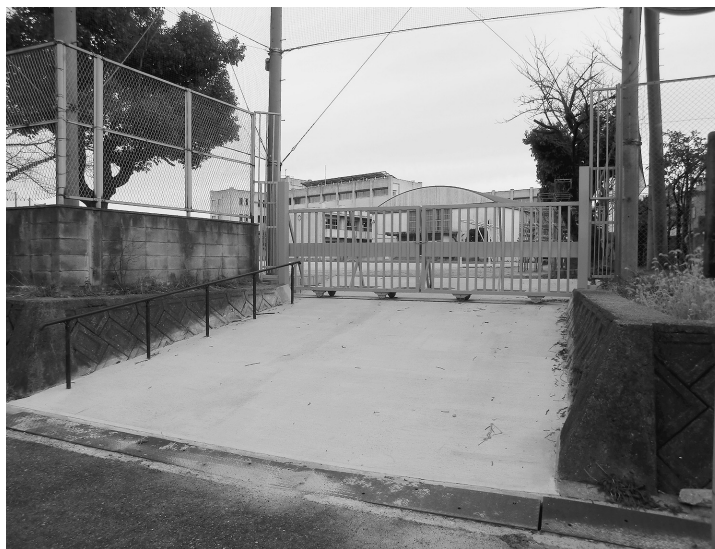
▲ 松原東小学校(避難所) 裏門の傾斜を緩やかに改修