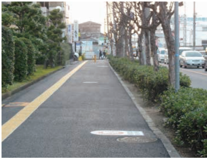
平成27年1月 府道大堀堺線、天美東7-12-25付近、ローズクイーン天美前の歩道の整備をさせて頂きました。