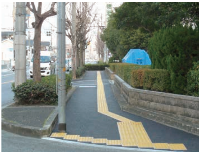
平成27年1月 府道大堀堺線、徳洲会病院前の歩道の整備をさせて頂きました。