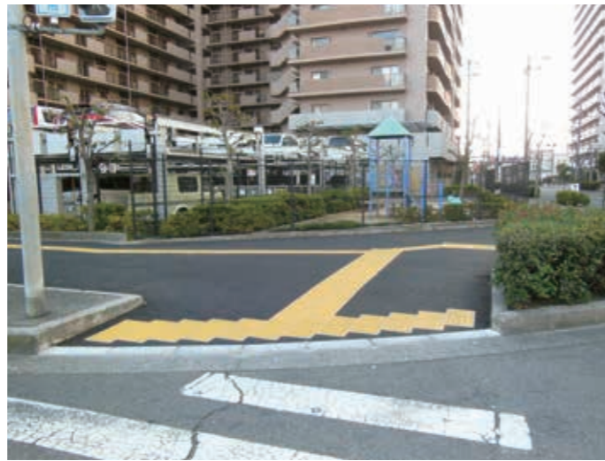
平成27年1月 府道大堀堺線、ルネグランステージ前の歩道の整備をさせて頂きました。