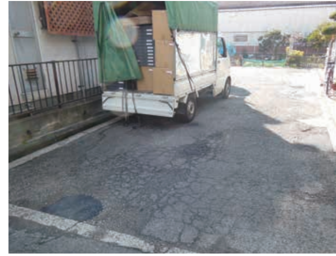
平成27年1月 小川5-14-11付近、安全確保のため、道路陥没の修理をさせて頂きました。