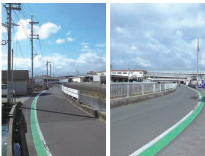
平成27年1月 大堀1-10-3大堀共同墓地から小川5丁目ぐるりん号バス停まで、通学路安全確保のため、グリーンベルトを付けさせて頂きました。