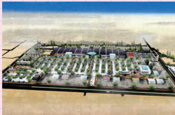
イオンタウン(平成32年 秋完成予定) 新堂4丁目