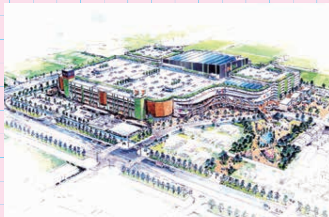
アリオ(平成31年 秋完成予定) 天美東2丁目